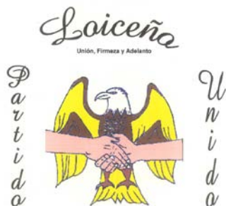
PARTIDO LOICEÑO UNIDO