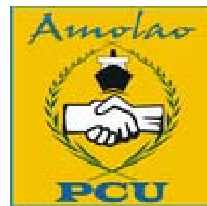
PARTIDO CATAÑESES UNIDOS