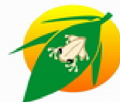
Puertorriqueños por Puerto Rico